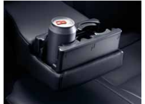
Задний держатель для стаканов

Это приспособление встроено в заднюю часть центрального подлокотника.