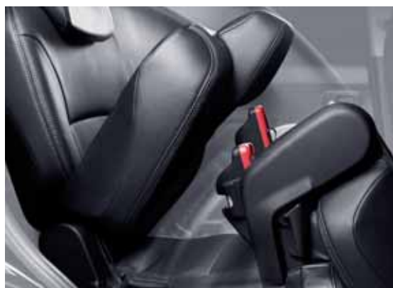
Задние сиденья – сдвижные, складываемые.