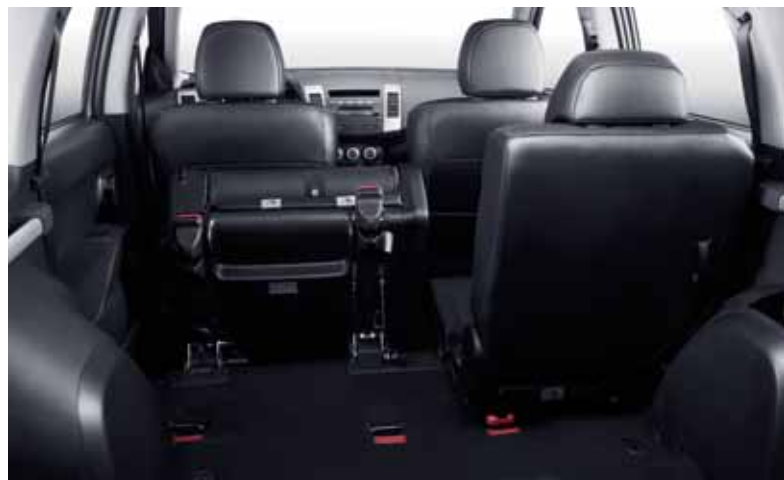
Складывающиеся сиденья второго ряда.

Для перевозки большого количества багажа или оборудования, необходимого в дальних поездках, задние сиденья можно разделить в соотношении 2/3 – 1/3, сдвинуть на 80 мм в продольном направлении. Кроме того, сами сиденья полностью складываются вперёд. В полу багажного отделения скрыто выдвигающееся сиденье, на котором можно дополнительно разместить двух пассажиров.