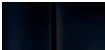
Черный жемчуг (Pearly Black)