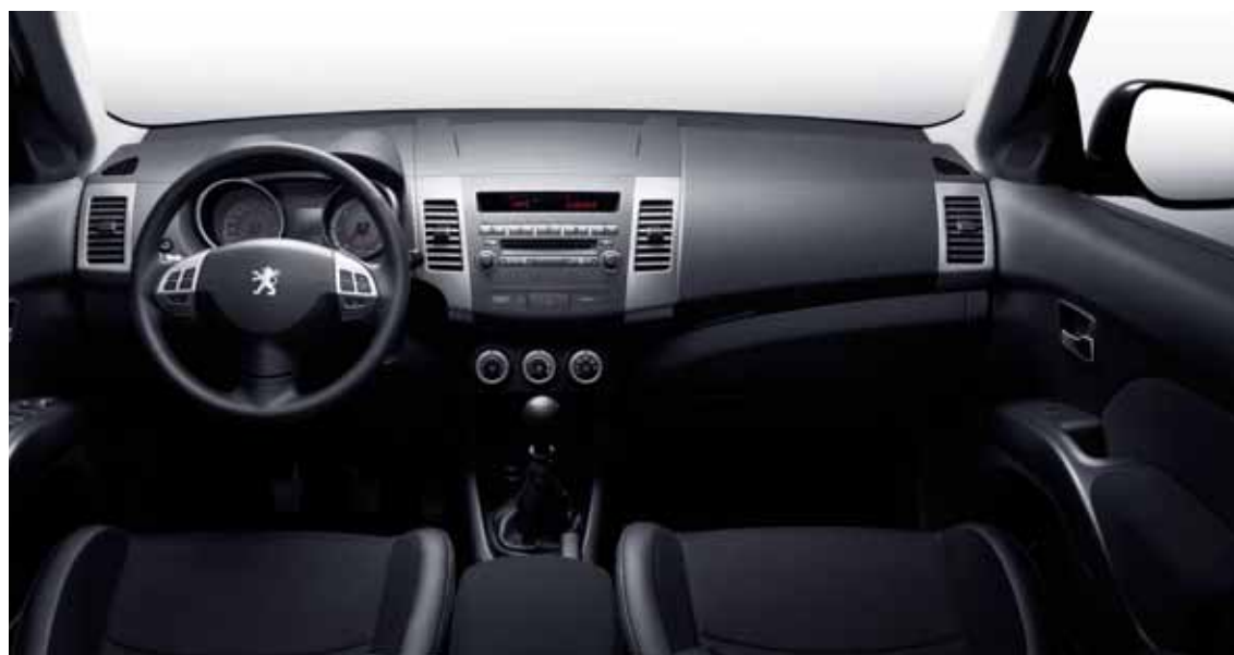
Интерьер автомобиля комплектации Premium