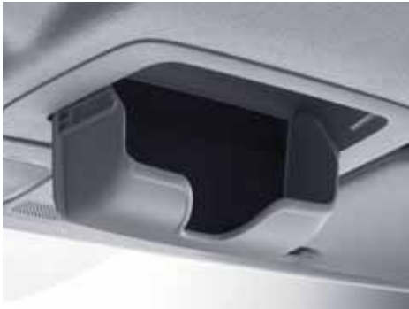
Потолочный держатель для очков