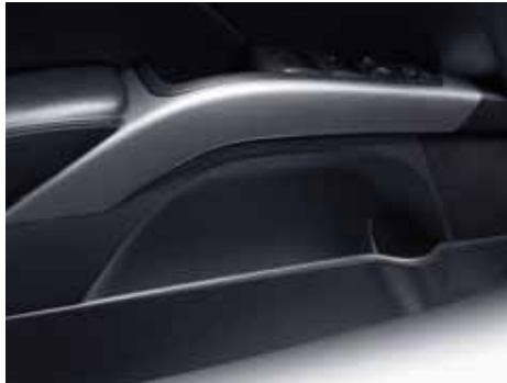
Дополнительные вещевые отделения