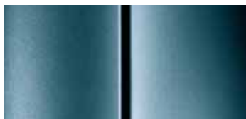
Голубой Байкал (Baikal Bleu)