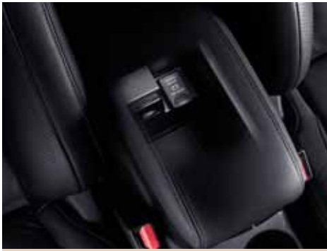
Подлокотник с розеткой 12 В

Центральный передний подлокотник Peugeot 4007 оснащен 12-вольтной розеткой, предназначенной для подключения небольших устройств или аксессуаров. Вторая 12-вольтная розетка расположена в багажном отделении.