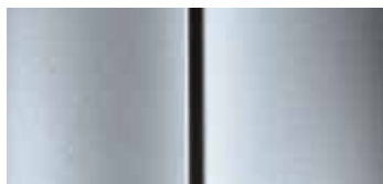
Серый холодное серебро (Cool Silver Grey)