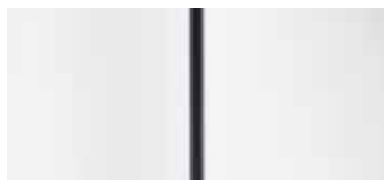
Белый Антарктида (Antarctic White)