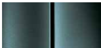
Серый Гаррига (Gris Garrigue)