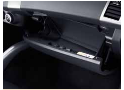
Нижний перчаточный ящик с подсветкой