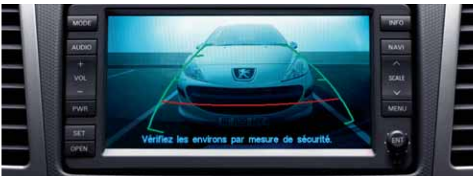
Дисплей камеры заднего вида*

Это приспособление встроено в заднюю часть центрального подлокотника.