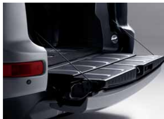
Нижний откидной борт, значительно облегчающий доступ в багажное отделение.