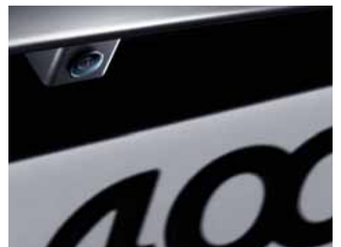
Камера заднего вида*

Активируется при включении передачи заднего хода. С помощью экрана навигационной системы Вы сможете определить траекторию движения автомобиля и расстояние, необходимое для открывания нижнего откидного борта багажного отделения.