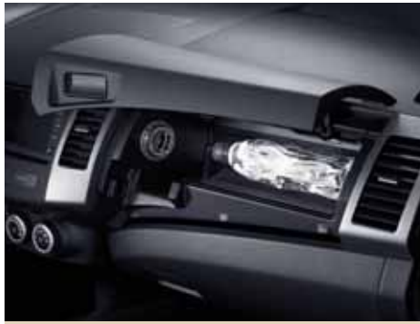
Верхний охлаждаемый перчаточный ящик

Центральный передний подлокотник Peugeot 4007 оснащен 12-вольтной розеткой, предназначенной для подключения небольших устройств или аксессуаров. Вторая 12-вольтная розетка расположена в багажном отделении.