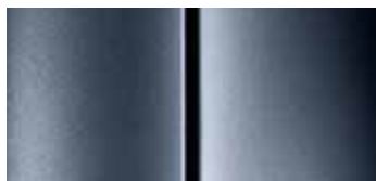
Серый Пилбара (Pilbara Grey)