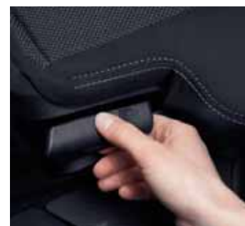
Переключатель для складывания сидений и регулировки наклона спинки сидений второго ряда.

Под дверью багажного отделения расположен нижний откидной борт, выдерживающий нагрузку в 200 кг и обеспечивающий небольшую высоту погрузки (60 см), что значительно облегчает доступ в багажник. Объём багажного отделения Нового Peugeot 4007 варьируется в диапазоне от 441 до 510 литров. За спинками сидений второго ряда открывается багажное отделение просто исключительного объема. При сложенных сиденьях объём багажного отсека достигает 1686 литров.