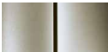
Бежевый Бархан (Biege Barkhane)