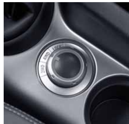
Переключатель режимов работы трансмиссии.